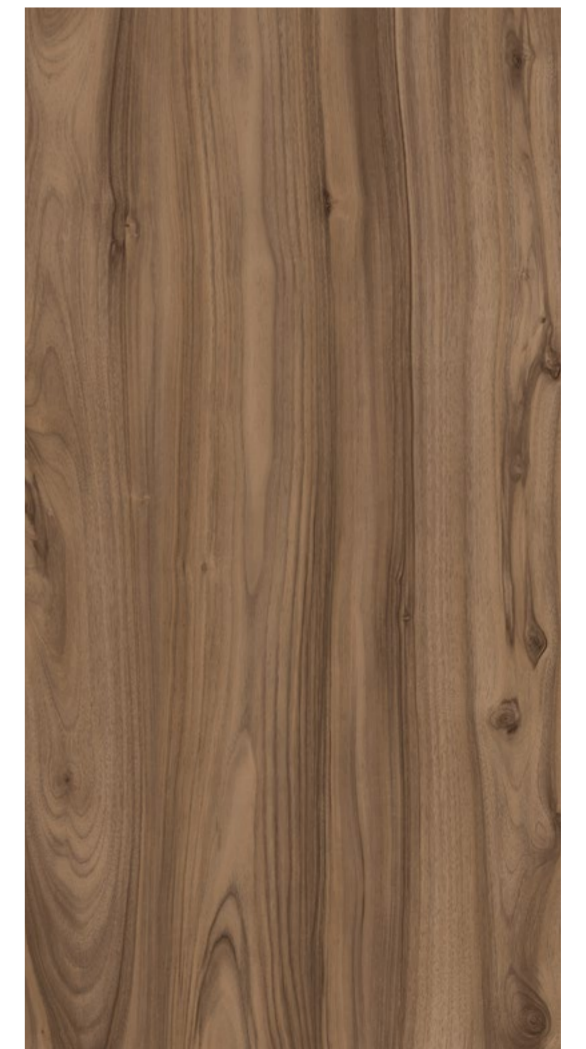
A539 SAN PIETRO