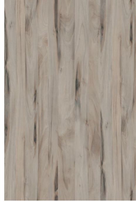
A542 SAN MARINO