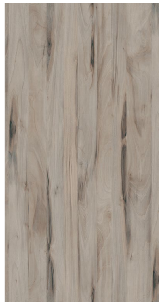
A542 SAN MARINO