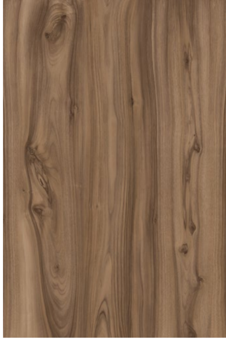
A539 SAN PIETRO